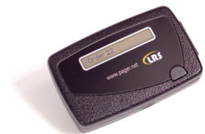
RX-SP5 : Bipeur alpha 1 ligne

La société LRS France – StarPager est le distributeur exclusif des produits LRS "Long Range Systems, Inc." en France.